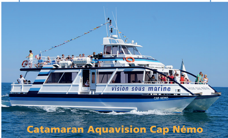
Catamaran Aquavision Cap Nemo

PROMENADE EN MER VISION SOUS-MARINE OBSERVATION DAUPHINS